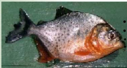
Palometa (Pygocentrus nattereri)